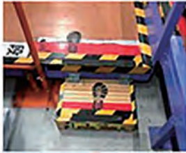
歩くべき箇所を「見える化」