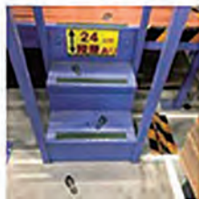
段差の高さを「見える化」